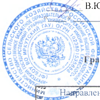
График экзаменационной сессии студентов заочной формы обучения на 2017-2018 учебный год (бакалавры)